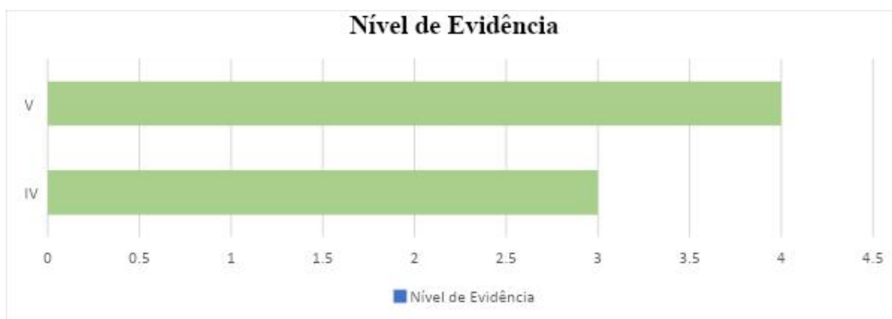
Gráfico 1 - Nível de Evidência.

O gráfico relata a demonstração das porcentagens em relação ao delineamento dos estudos, pois é suma importância essa informação, Gráfico 1.